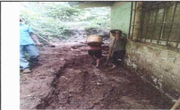
Foto 3. Se observa a los alumnos quitar tierra por dezlizamiento ya que el muro que estaba fue arruinado