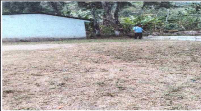
foto 1. SE observa deterioro del muro perimetral