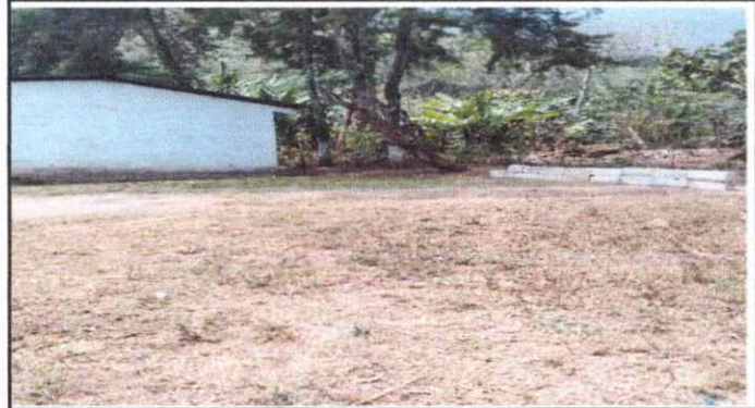
Foto 2. Sustitucion de muro perimetral